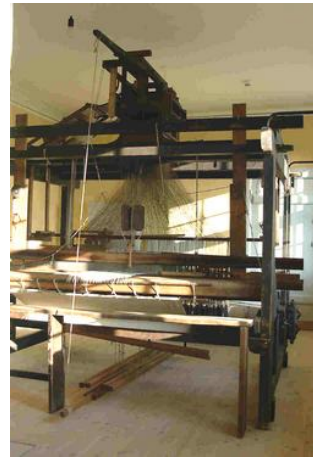
"I væverens fodspor"