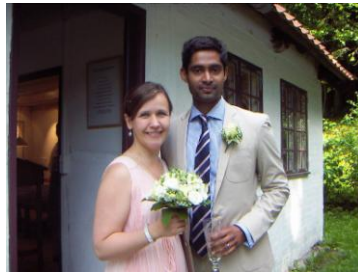
Bryllup 27. juli 2011