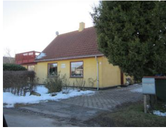
Rigmors hus i Røstofte (dec. 2011)