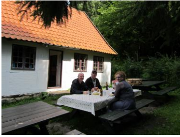
Besøg fra New Zealand august 2011