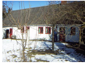
Lergravvej 24 – (6.marts 2010)